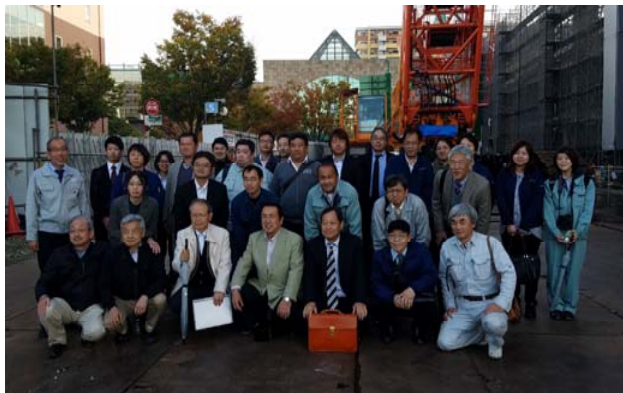
現場前にて集合写真