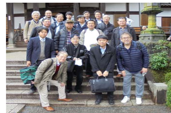
修善寺にて集合写真