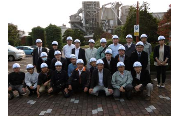
工場をバックに集合写真

関東最大級のセメント工場の見学は、セメントの生産各工程の紹介など、初めて聞くことが沢山あり、とてもわかり易く説明を頂きました。入社してから、早いもので一年が過ぎました。日頃はデスクワークが多い私にとって、今回の現場見学は大変勉強になりました。今後の設計に生かせるようにさらに勉強して行きたいと思います。