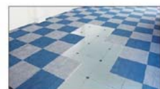
ウッドコアスチールフロア (WSB500N)