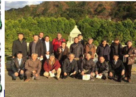
国会議事堂の前で集合写真 (東武ワールドスクウェアにて)