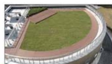
屋上緑化 エコグリーンマット