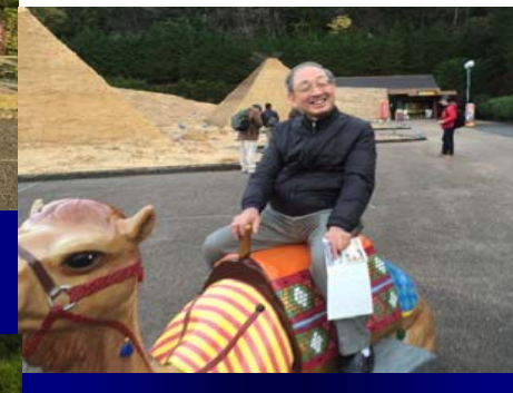
ラクダに乗りご満悦 (東武ワールドスクウェアにて)